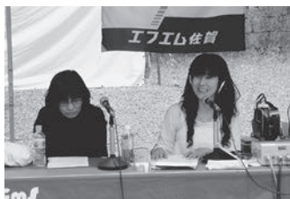
▲去年の公開生放送の様子

「MY DEAR 神埼 九年庵公開生放送」に遊びに来てください。ね。九年庵前でお待ちします!