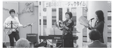
10月はコールポケットの演奏でした