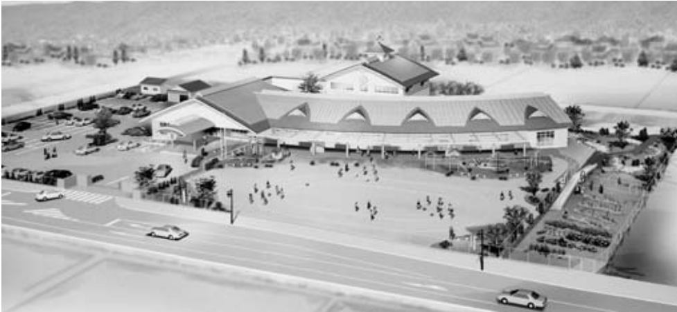
▼旧千代田町における完成予想図

旧千代田町では平成12年頃から、ともに老朽化している町立城田保育園と町立境野保育所の統合保育所建設計画が叫ばれ、その機運の盛り上がりとともに、建設場所の選定、用地の確保に向けた動きがなされていきました。その後、町の財政事情から一時、建設断念の状況になりましたが、保護者などからの保育所建設への願いは根強く、平成16年12月の千代田町議会において保育所建設問題が論議され、建設計画の実現が求められました。 これを受け、町執行部は平成17年度に、平成19年4月1日開園に向けた建設用地の買収契約の締結（平成17年10月21日）および建設基本設計書（コンペ方式）の作成（平成17年9月上旬）を行い、さらに保育士および保護者などとの意見交換を重ね、建設費3億円を限度とした最終的な実施設計書が作成（平成18年1月31日）されました。