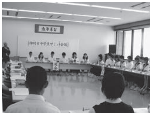
神崎市子育て5か条

また、今年度は中学生全員で「東日本震災支援アルミ缶回収」と「クリン作戦への積極的な参加」「ボランティアパスポートを活用したボランティア活動」に取り組むことを決めています。