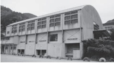
▲解体や設計の委託費を計上した脊振中学校体育館

千代田庁舎改修工事は、幹線水路の法面補修が国営事業として実施されるため、庁舎内に九州農政局の事業所が10月に開設されるのに伴い、一部を改修し貸し付けるものです。