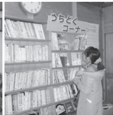
▲右原地区のすぎの子文庫の中に 設置された家読コーナー