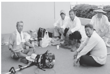
☆神埼中の草刈をお願いした皆さん

※登山 (4人) とスケッチ会見守り (3人) は、残念ながら雨で中止となりました。