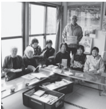
▲猪面地区での家読活動

家庭のコミュニケーションと地 域の絆を深める家読(うちどく) モデル地区に、「右原地区」、「城原 地区」、「猪面地区」の3地区が決 定しました。 「右原地区」は地区内にある私設 文庫の「すぎの子文庫」で、「城原 地区」と「猪面地区」は地区の公 民館を拠点として今年から2年間、 本を通しての活動が行われます。 早速、県立図書館からそれぞれ の地区に100冊ずつ本が配本が されました。これから2ヶ月おき に本の入替えがあります。