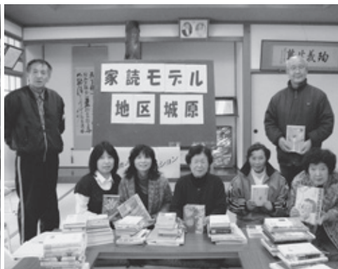
▲城原地区での家読活動