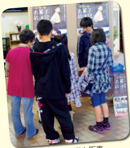
映画の当日券も販売

また、鍋と釜の祭は中止となりましたが、食改さんや婦人会の皆様のご厚意で大鍋料理が「おふるまい」され、おもわぬ「神埼の秋の味覚」に、映画会の来場者やバザーに来られた皆さんからは「大変おいしい」との声が聞かれました。