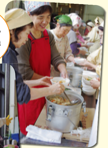
ふるまいも大忙し