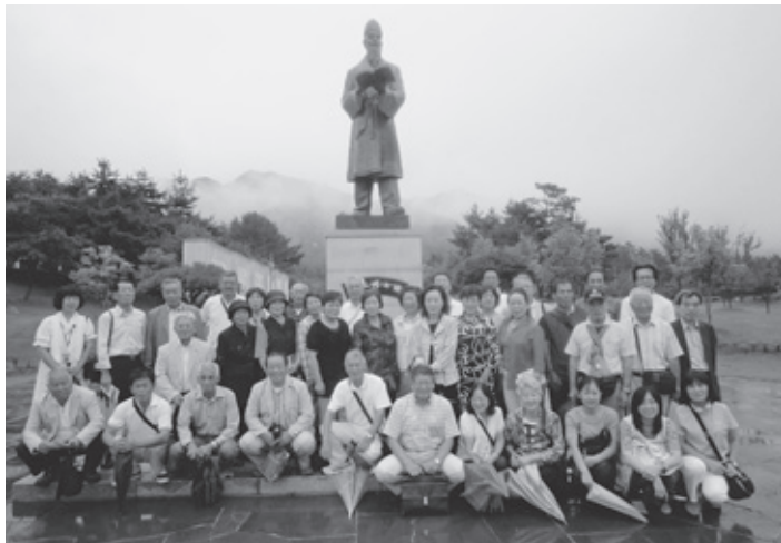
▲王仁博士生誕地である韓国霊岩郡を訪問し、調査研究を重ねています

す。全国の自治体はそれぞれの地域の特性（自然や歴史、風土）を活かしたまちづくりを考え、地域の活性化を図ることに懸命です。神崎市においても町の活性化、「元氣かんざき」を目指し、市民一丸となつてのまちづくりに努めていただいていることに感謝する次第です。 町の活性化の方法については、いろいろな考え方や取り組み方がありますが、