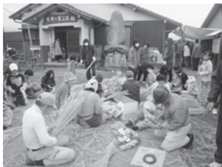
冬「交流しめ縄作り」

また、世代間交流イベントを継続して行うことで、地域の絆も回を重ねることに深まっています。そして、もう一つの取り