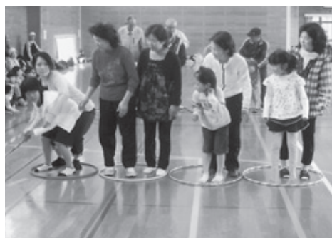
春「交流レクリエーション大会」