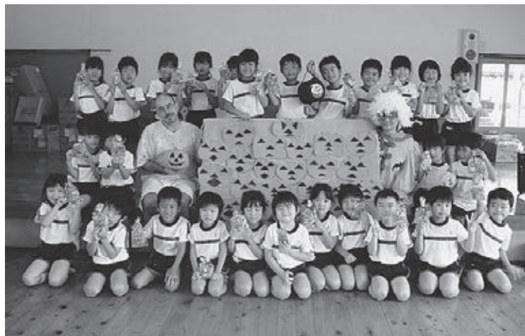
▲外国の文化を学ぶ子どもたち

教育の重要性和国際時代に対応できる人材の育成にかんがみて、平成20年度から小学校で英語指導講師を招き英語教育を実施しています。この成果は、すでに中学校の英語の先生から「生徒とのコミュニケーションにおいて英語感覚が感じられます」との評価の言葉をいただいています。 市内の保育園や幼稚園においても教育的指導に取り組みられています。