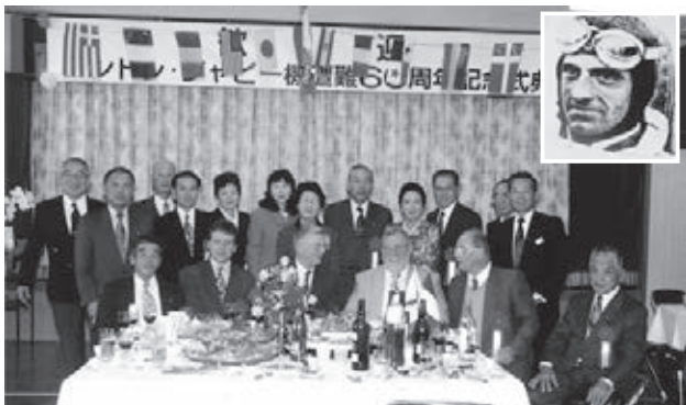
▶アンドレ・ジャツピー機遭難60周年記念式典

経過概要…1936年11月19日、パリから東京に向うフランスの飛行家 アンドレ・ジャツピー氏が操縦する飛行機が脊振山中腹で、エアポケットにかかり墜落、遭難した。このジャツピー氏を脊振村民が救出したこ