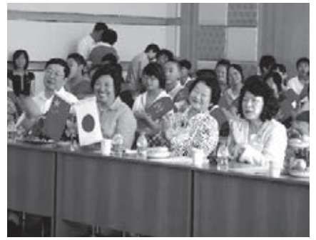
▲脊振中学校訪問団の歓迎式の様子