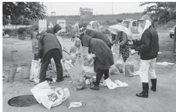
環境美化活動としての神埼市クリーン作戦