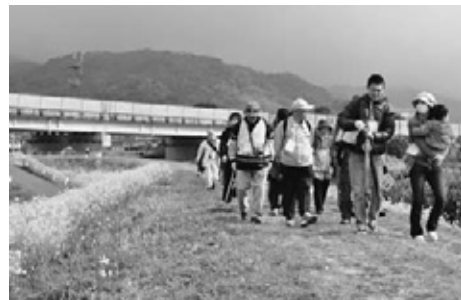
平成23年3月の城原川見学会

身近にある、神埼の歴史・文化・自然などを、 実際に現地を訪ねて、新しい発見をしませんか。