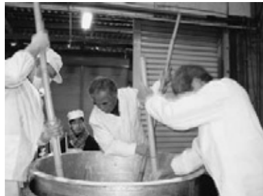
3月 杜氏によるしこみ

生のヒシの実約400キログラムから、アルコール度数41度の焼酎124リットルが完成しました。これから、焼酎原酒をかめで熟成させまろやかでおいしい焼酎を目指します。