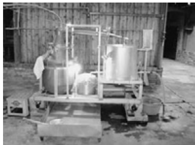
最後の工程の蒸留作業