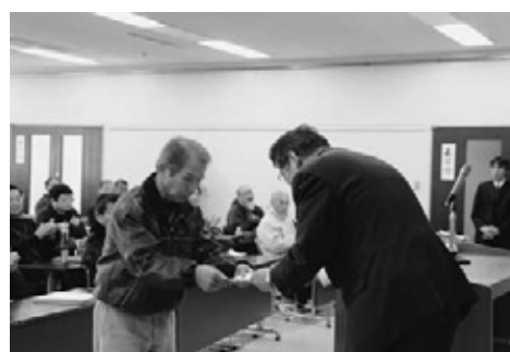
市民学芸員認定証授与式