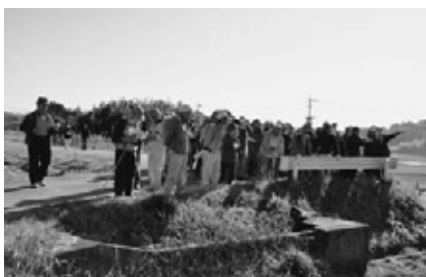
平成22年12月の勢福寺城跡見学会