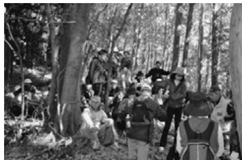
勢福寺城跡 山頂部にて