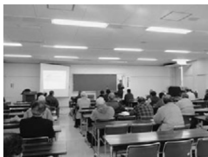
昨年度の講座の様子