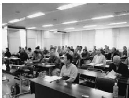
熱心に学ばれる受講生