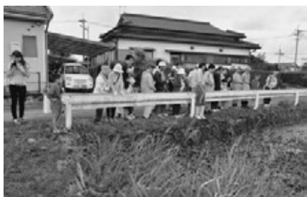
平成22年9月の水草観察会