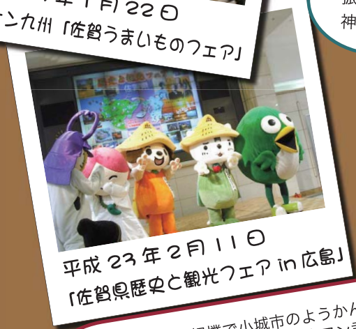
平成 23 年 2 月 11 日 「佐賀県歴史と観光フェア in 広島」