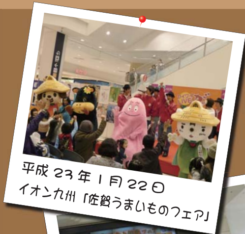
平成 23 年 1 月 22 日 イオン九州「佐賀うまいものフェア」