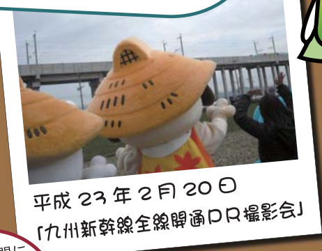
平成 23 年 2 月 20 日 「九州新幹線全線開通PR撮影会」

運動会では、尻相撲で小城市のようかん右衛門に勝ったワン。この後、唐津市の唐ワン君と友達になって、クリスマス会にも呼ばれたワン。これからも神埼のためにがんばるワン!