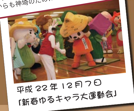
平成 22 年 12 月 7 日 「新春ゆるキャラ大運動会」