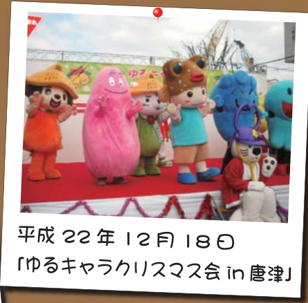
平成 22 年 12 月 18 日 「ゆるキャラクリスマス会 in 唐津」