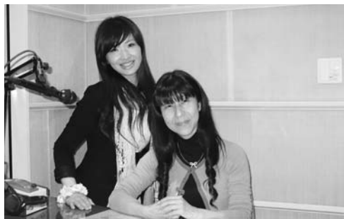
▲パーソナリティの皆さん