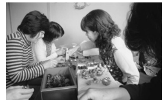
▲どんぐり工作の様子

子育てに関わる人たちが自由に集いおしゃべりする場です。今では気軽に立寄れる憩いの場として定着してきました。小さい子どもを連れのお母さんからおばあちゃん、おじいちゃん世代までくつろいでおられます。いつもの絵本やおもちゃのほかにも、どんぐり工作を楽しんだり、クリスマスカードを作ったりして過ごすこともできました。肩の力を抜いて、また子育てをしていけるよう、家庭教育支援チームは皆さんをやさしく応援します。