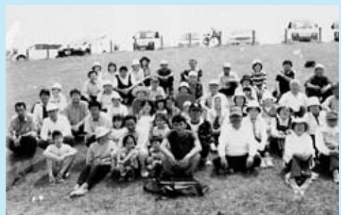
▲河川敷でのレクリエーション大会

地区では、10 月に安全と豊作を願って龍宮祭を行い、また、春祭り・お観音さん祭り・お地藏さん祭りなどの古き伝統のほか、河川敷でのレクリエーション大会など新しいものを取り入れながら交流を行っています。