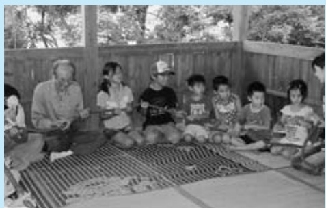
▲無病息災を願う「百万遍」

また、5 月の「姉下フェスタ」では、「ひゃあらんさん祭り」「ランドゴルフ大会」を行うなど、住民同士の交流を深める活動や安全安心な地域づくりに積極的に取り組んでいます。