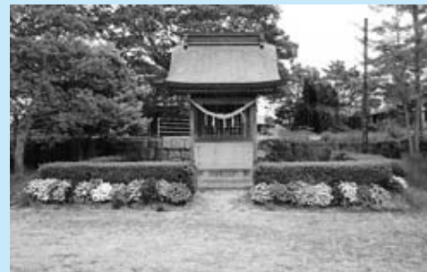
▲12 月に村祭りが行われる海童神社

神埼町の体育祭には、いつも全員参加で、ミニ部落で優勝するなど、大変まとまった地区です。