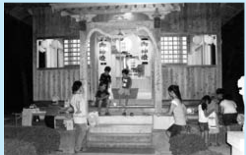
▲祇園祭での住民交流