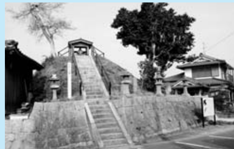
▲長崎街道で唯一残る「ひの柱一里塚」

新宿から姉本村にかけても部分的に街道が残り、境原宿も県道で切られてはいますが、たどることの出来る貴重な道筋です。境原という地名も佐賀との境から付いたもので、まさにそのまま現在も佐賀市との境界に、郡境石が残っています。