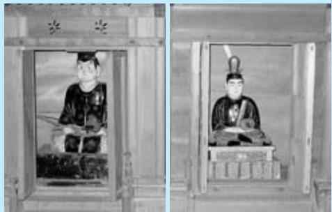
▲鎮西八郎為朝(左)と菅原道真(右)のご神体

当時の統治者の人材育成という思いからか、地区には氏神様として、菅原道真公（天満宮）と鎮西八郎為朝の文・武の二神体が併祀されています。また、神社では、春には桜の花見、秋には村祭りが行われ、住民の融和を図っています。