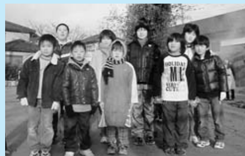
▲毎年行われるしめ縄焼き

団地公園の石碑に、「永遠の睦みを礎に」の文字が刻まれています。私たちが守り続けたい言葉です。