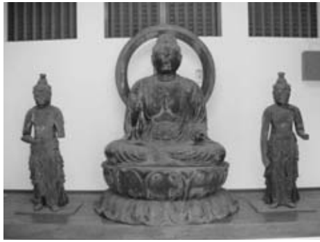
▲木造薬師如来座像及脇待菩薩立像

うことができ、人々に現世の利益を与えることができる仏様として、古くから盛んに信仰されてきました。日光菩薩・月光菩薩は、本尊である薬師如来の両脇に侍して本尊を助けるもので、脇待というものです。