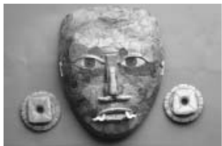
▲ヒスイ製仮面 (カンパチエ博物館(INAH)蔵)