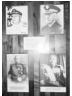
▲日米の指揮官の写真

ワイキキから20kmくらいの所に真珠湾があり、そこにはアリゾナ記念館という建物があります。これは真珠湾攻撃により撃沈された戦艦アリゾナ号の残骸