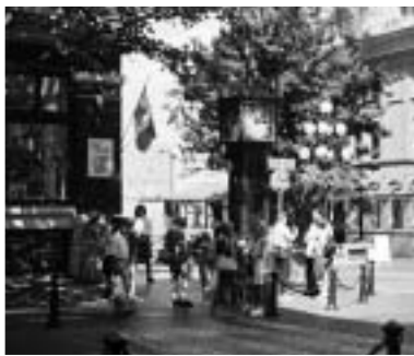
▲ギヤスタウンの蒸気時計

日本では以前に五千円札のモデルになりました。彼はバンクーパーの近くにあるビクトリアという街で病に倒れ、その地で没しました。