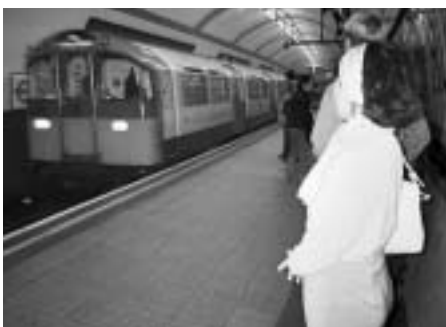
▲ロンドンの地下鉄

イギリスでは女性に親切にするという習慣が特に強く、男性は普通にそれを実践します。最初にロンドンへ行った時は、ヒースロー空港から市内へ地下鉄で行きました。ラッセルという駅で降りて地上へ出ようとする時でした。通り過ぎようとした若い男性が階段の手前で「手伝いましょうか?」と言って妻の荷物をさっさと運んでくれました。妻はその親切に感激していました。