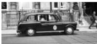
▲オースチン・タクシー

チップの習慣についてカナダ人のジャーナリストと話をしたことがあります。彼にとってはチップの習慣はあった方が良くということでした。これによってサービスに対する自分の満足度を意思表示できるからというのがある理由です。彼は、サービスが非常に悪いときにはチップを渡さないと言っていました。