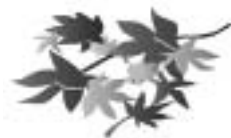
市の木：紅葉(もみじ)