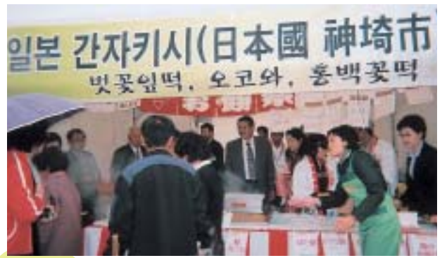
▲市民で賑わう会場