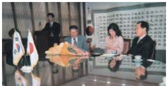
▲慶州市庁舎において