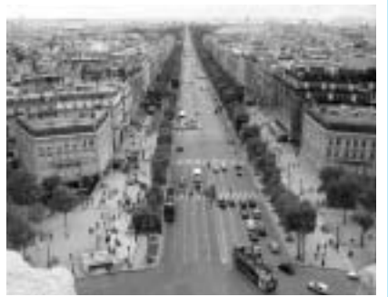
▲凱旋門の屋上から見たシャンゼリゼ通り

金をどのような形で持っていたのかは海外旅行で頭を悩ますことの一つです。百万円近くの大金を現金で持って行ったら盗難に遭ったという話を聞いたことがあります。私は、現金は多くても四〜五万円しか持って行きません。その代わりにクレジットカード二枚と旅行者小切手を持って行きます。街で持ち歩く財布にも一万円相当額以上の現