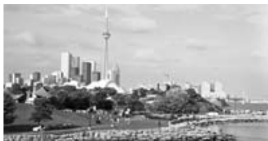
▲ CNタワーとスカイドーム

トロント「その一」 トロントは五大湖のひとつ、オンタリオ湖岸にひらけたカナダ最大の都市です。ナイアガラ滝に最も近い大都市と言った方が分かりやすいかも知れませんが、世界のウオーターフロント開発(沿岸開発)において先駆的な役割を果たした街で、各地の港湾開発はここをモデルにしたところが多いといわれています。トロントの地名はインディアン語で「人の集まる所」という意味です。もともと毛皮の集散地で、人がよく集まったことに由来しますが、今でもその名の示す通り、世界各国からさまざまな人々が集まって来ています。トロントには70以上のエスニック・コミュニティ(民族社会)があり、話されている言語は100以上であると言われるています。市電や地下鉄に乗ると、公用語の英語及びフランス語以外に、聞き慣れない言語がいろいろと聞こえてきます。カナダは多民族国家でいろいろんな人種の人が集まっています。この点ではアメリカと同じですが、アメリカが人種の「るつぼ」であると言われるのに対し、カナダは人種の「モザイク」であると言われます。アメリカでは、いったん移民したらアメリカ文化にとけ込みなさいという政策がとられているのに対し、カナダでは、それぞれの民族が独自の文化を維持してよいという政策(多文化主義)がとられているからです。そのため、カナダでは出身国別に民族社会をつくり、その文化を強調する傾向があります。例えば、トロントにはイタリア人街、中国人街、韓国人街などがあって、その地域へ行けばまるでその本国へ行ったかのような雰囲気があります。トロントの人は「世界一」というのが好きなようで、それを示すものがいくつもあります。まず、世界で最も高いCNタワーというのがあり、553mあります。鉄筋コンクリート製の放送電波塔で、地上447mの展望所まで人が登ることができ、その展望所にはスペース・デック(宇宙階)という大げさな名前がついています。次に、スカイドームという野球場があり、開閉式のドーム球場では世界初です。収容人員7万人で、私がトロントにいた頃は世界最大でした。写真はトロント中心部の遠景で、中央の塔がCNタワー、その前の丸屋根の建物がスカイドームです。また、世界最長のヤングストリートという通りがあり、長さは43kmで、ギネスブックにも載っているそうです。その他、世界最大級のナイアガラの滝がトロントから車で1時間半の所にあり、その近くに世界で最も小さい教会があります。