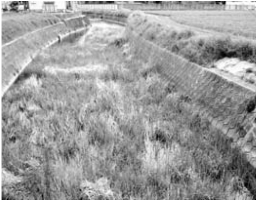
水草の除去と河床の浚渫を急げ (鶴東付近の河川)

議員 中央公民館東側から上流鶴東の県道付近までの区間が水草で覆われていて、流れが悪くなっているが、河川の管理者である県に要望をお願いしたい。 産業建設部長 中央公民館東側から上流鶴東までの間にかけては、水草が繁茂しているのが現状であり、このことについては、河川の管理者である神崎土木事務所が把握しており、水草の除