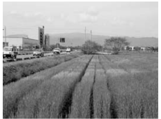
早期完成を望む、南部工業団地

域工業等導入促進法に基づき、九州農政局と話をつめているところで、内部調整の段階である。今後は、工業団地の早期完成に向け、九州農政局と話を進めていく。