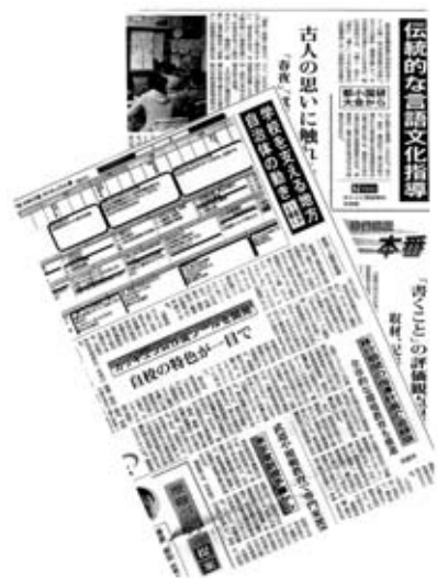
新学習指導要領実施に向けた移行措置が始まる