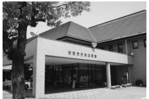
改修が急がれる文化活動の拠点 神崎市中央公民館

入っています。入っています。入っています。寒い人は、後ろの上の方が比較的暖かくなっています。」とアナウンスがあった。市内外、県外からも来訪者があり、夏は暖かく、冬は寒くという状態で文化の拠点・シンボルと言えるのか。改修する時には温暖化対策の柱である太陽光発電も検討すべき。 教育部長 調査委託をし検討したい。