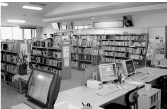
市民が集う市立図書館