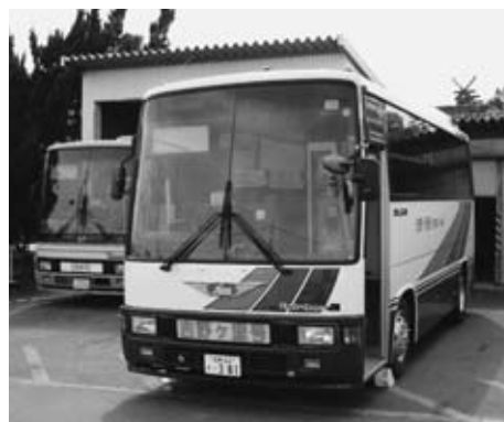
神崎市所有のマイクロバス

保育園は同じ保育基準に基づいて運営が行なわれている為、市が所有するマイクロバスの利用については、公立、私立問わず同じように利用できないものか。 船津財政課長 神崎市のマイクロバスの管理及び使用規則により市の行政と関連づけられる行事であるものは、使用許可の判断をしていく。