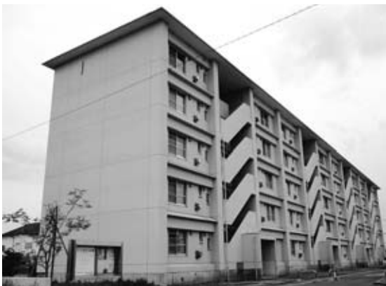
どうなる雇用促進住宅「水の郷」