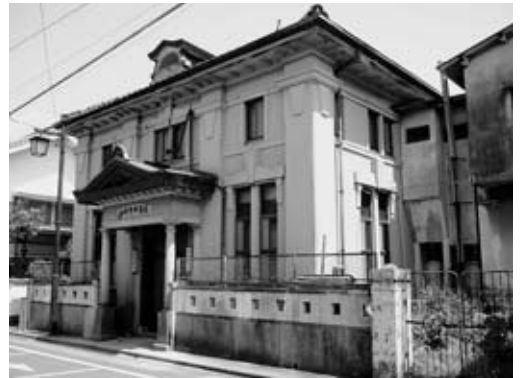
由緒ある洋風外観の旧福成歯科医院

議員 街道沿いにある由緒ある洋風外観の建物だが放置するのか、何か手立てを考えるのか。