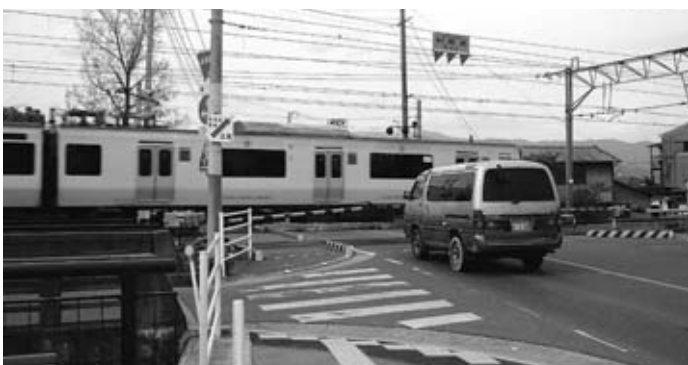
新幹線開通後、交通渋滞と安全が心配される踏切