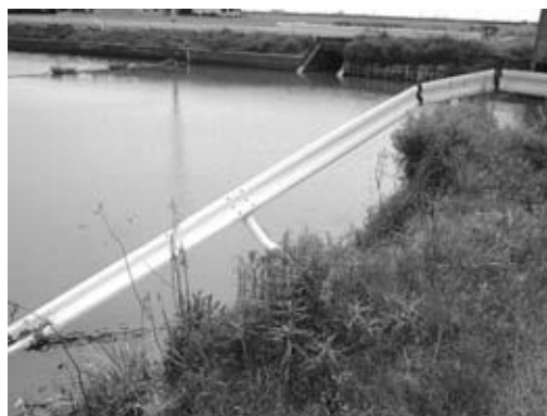
クリーク防災事業の進捗は

議員 平成20年度より特定検診が始まったが、受診率を引き上げてメタボ該当者や、予備軍を