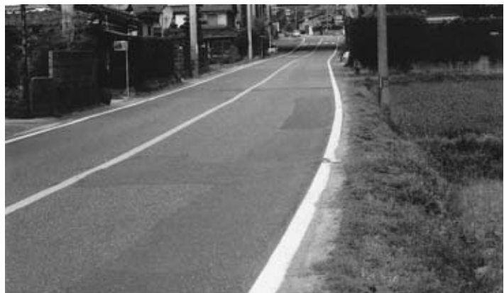
狭く危険な通学路 (飯町付近)