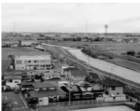
城原川の安全対策は大丈夫か

議員 今、地権者の人達が心配されているのは、隣のみやき町が同じ様な工業団地を造成されているが、今日の経済不況で農地の取得については、一時待つておくと聞くが神崎市では農地の許可が農政局から出れば、今日までの経過から考えると地権者の人達ときちんと話し合っ土地は買収すべきではないか。 市長 景気が悪ければ又、景気