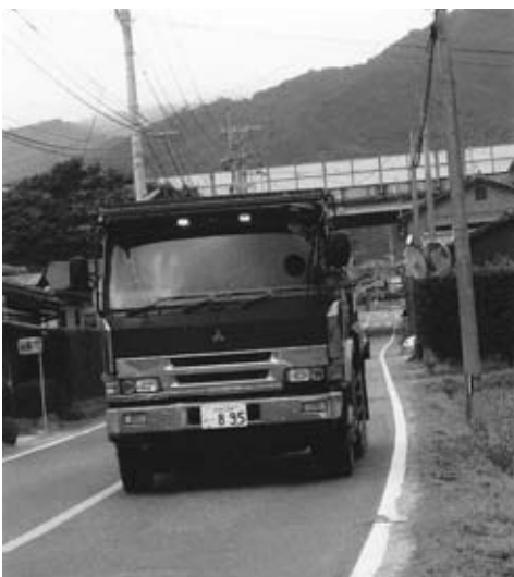
児童生徒の通学の安全は大丈夫か

歩道設置場所は、道路の幅員も狭く、危険な箇所と承知している。子供を交通事故から守る為にも、一日も早く歩道設置を県に強く要望をしていきたい。