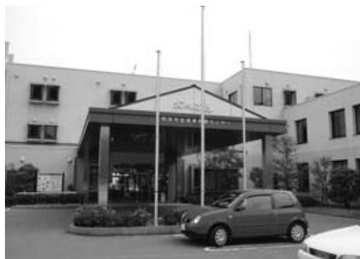
民営化された佐賀健康保養センター かんざき

現在神崎市内14ヶ所の踏切があり、安全性の確保、又遮断中の交通渋滞等、厳しい面があることは認識している。