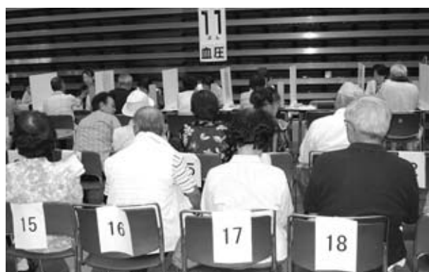
特定健診の受診率を上げて市民の健康を

市民福祉部長 20年度に税率の改正を行ったが、国保税の伸びがなかった。又国庫支出金の歳入が計画見込よりかなり減収している。歳出は前期高齢者交付