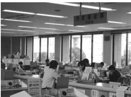
市民の窓口 千代田総合支所の市民課

議員 1年を経過しようとしている制度のシステム構築がまだ出来ていない。 不十分なまま制度が運営されている。