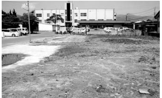
どうする来庁者の駐車場対策 (本庁南側駐車場と隣接した空き地)