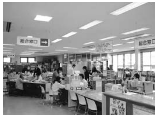
市民の窓口 本庁舎の総合窓口

議員 保険料の負担が重過ぎるなどで、不服審査の申し立てが全国的に出されているが、神崎市における不服審査の状況と、年金天引きから普通徴収への変更状況はどうなっているか。 市民福祉部長 不服審査につい