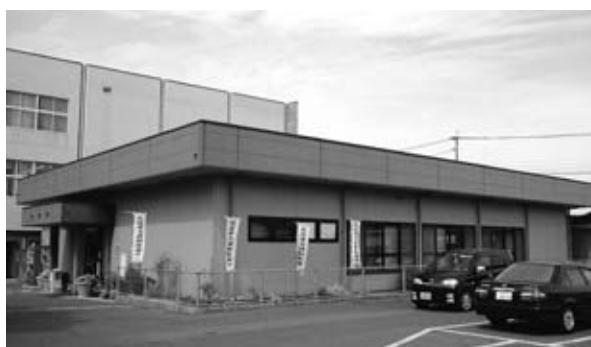
太陽光発電が予定される 本庁舎南新館屋上

来なくなる心配も無く、地球温暖化や酸性雨の原因となる二酸化炭素も発生しない。地球温暖化対策としてのクリーンエネルギーの導入計画を尋ねる。 総務企画部長 新年度予算に本庁舎南新館屋上に太陽光発電の設置、ハイブリッド車の導入も計画している。この実行計画に基づき建設計画がされている西郷保育園、学校給食センター等、公共施設への導入を図ってきたい。個人住宅への太陽光発電の設置については補助制度も設けている。