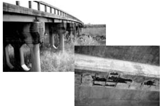
安全と治水対策からも早期架け替えを望まれる新宿橋

議員 市の予算には、市独自の商工業、農業の発展に対する政策的予算付けが見られない。市内の商工業者の血のにじむような努力に対し、市はもっと積極的に、頑張るところには財政的にも応援をする姿勢がほしい。新規技術研修や商品開発等に関する研究補助など、商工費の中