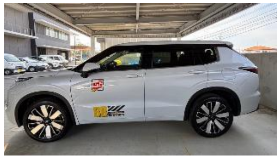
災害対応型電気自動車