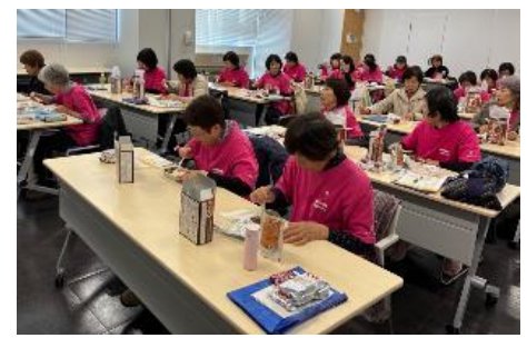
R7年度に実施した研修の様子