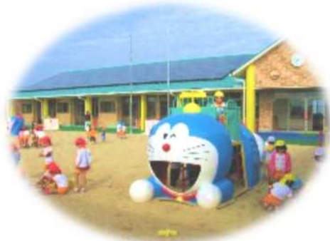
（詳細はホームページをご確認ください。）