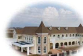
⑥サールナートこども園