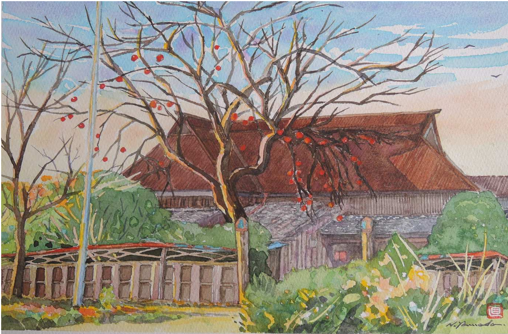
真崎大将の家(神崎市千代田町上西)

「神埼の偉人35」によると、真崎甚三郎大将は青年将校の信望が厚く、一兵卒まで名前を忘れずにいたわった。そして大将の長男真崎秀樹氏は、戦後昭和天皇の通訳を長く務められ、天皇・皇后両陛下のご訪米の折にも活躍された。