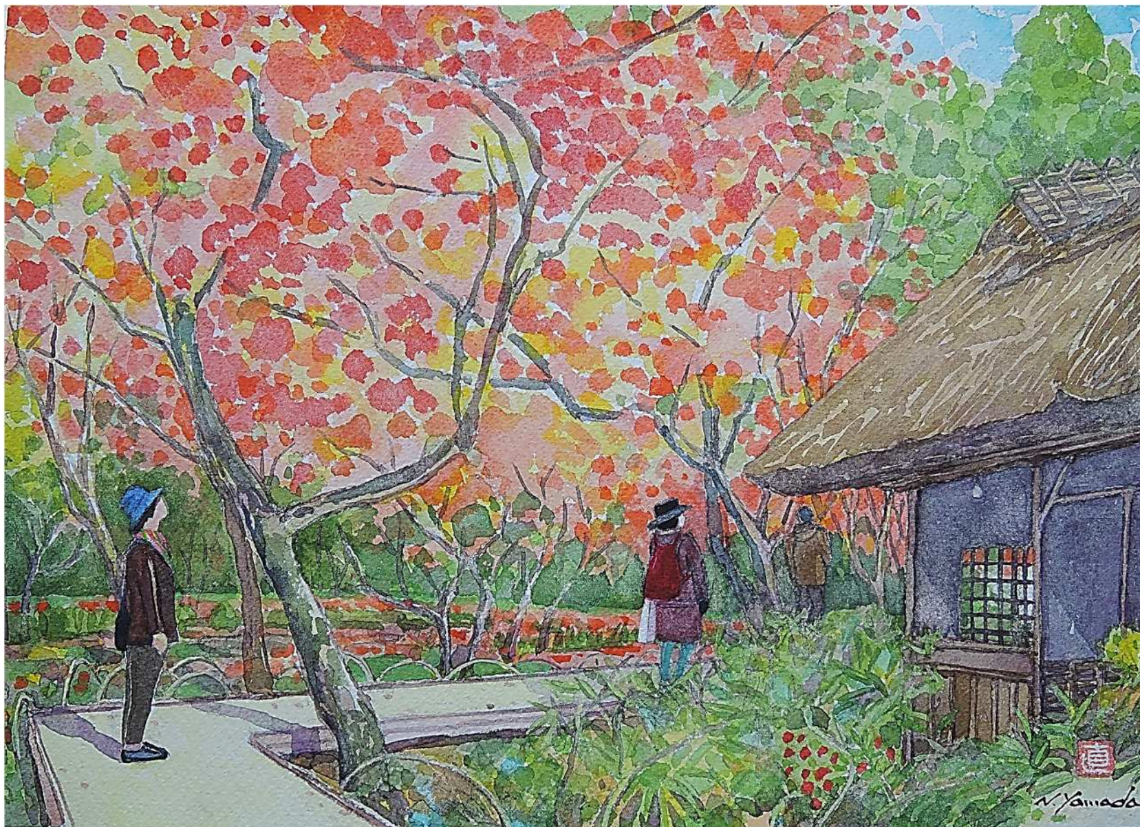
紅葉の九年庵(神崎市仁比山)