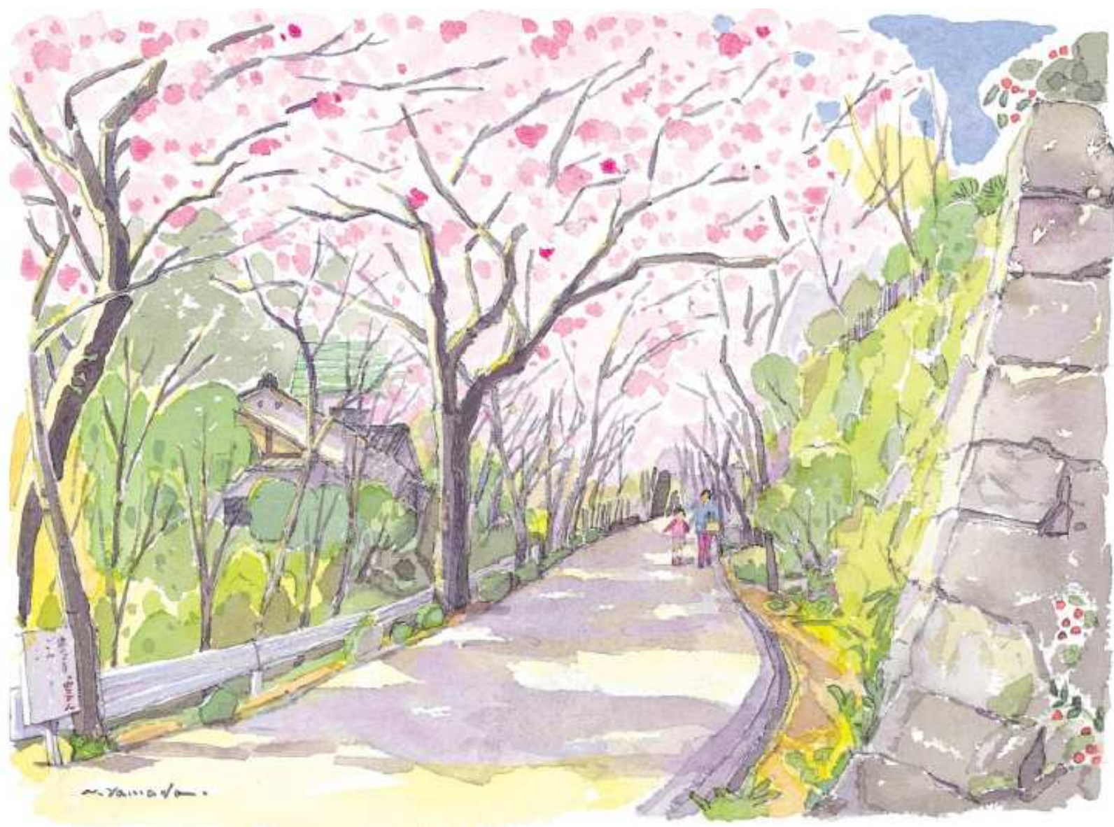
桜の坂道(神崎市仁比山)