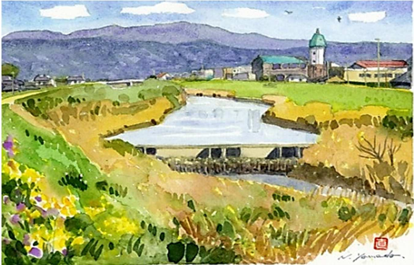
水ぬるむ城原川(お茶屋堰) 御茶屋堰から取水した川の水は蓮池のお城にも通じていました。