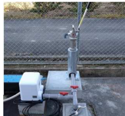
< 協力井戸 >