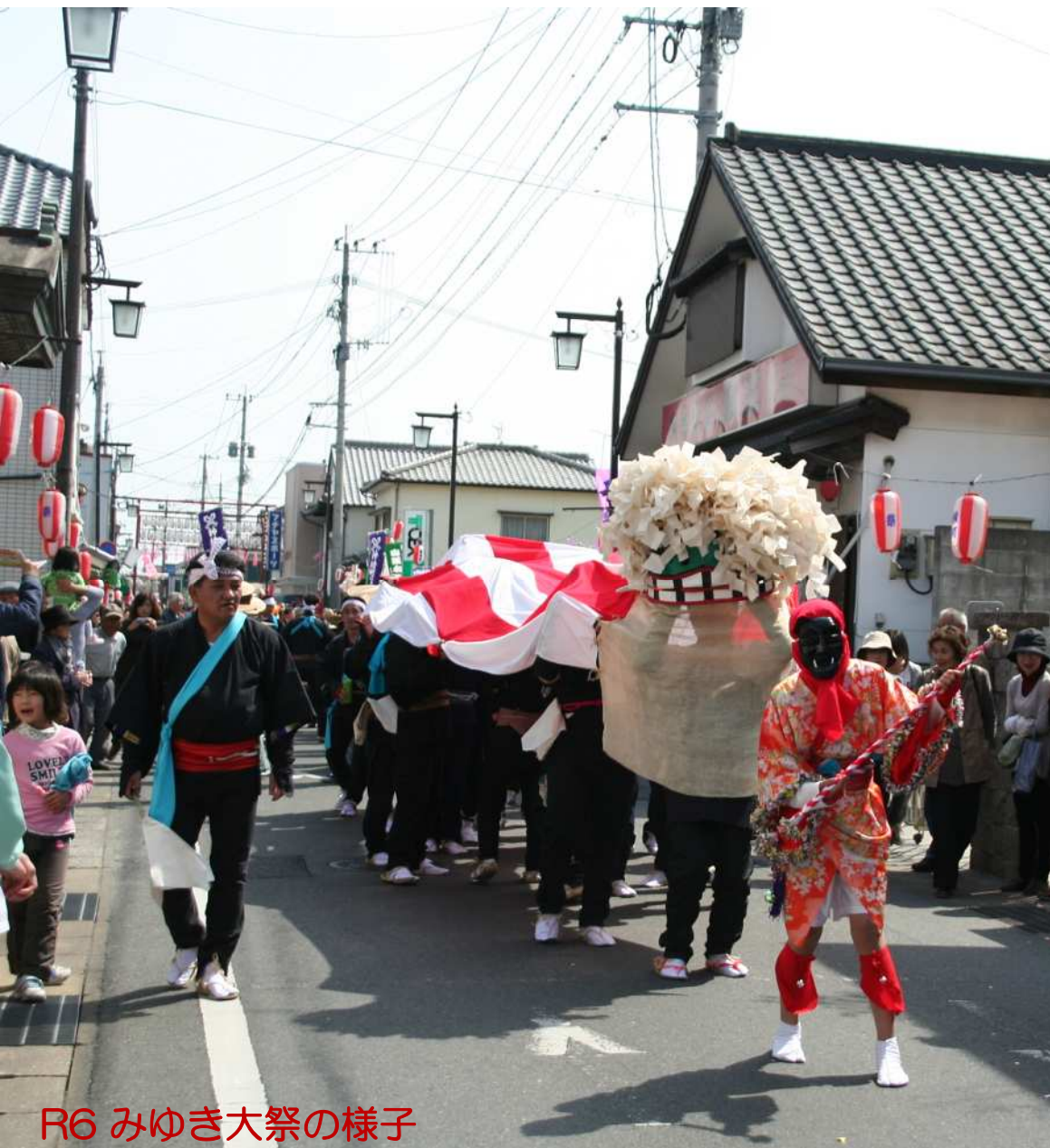
R6 みゆき大祭の様子