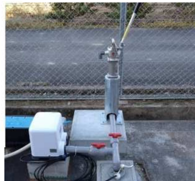
< 協力井戸 >