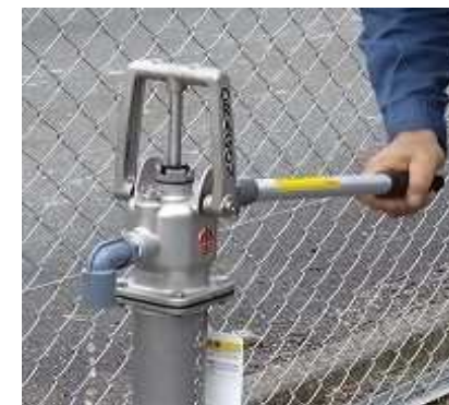
< 手動ポンプ >