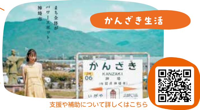
支援や補助について詳しくはこちら

子育て世帯や新婚世帯が同居・近居するための住宅改修費を補助します。 対象 18歳未満の子どもを含む子育て世帯、婚姻1年以内の新婚世帯など 補助額 工事費の1/3(上限50万円)