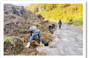
▲高取山公園での植樹体験