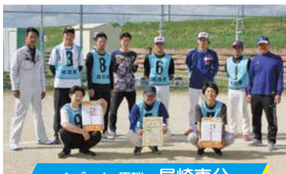
Aパート 優勝 尾崎東分

10月26日、第20回神崎市軟式野球大会が筑後川運動公園グラウンドで開催され、10チームが参加し熱戦を繰り広げました。