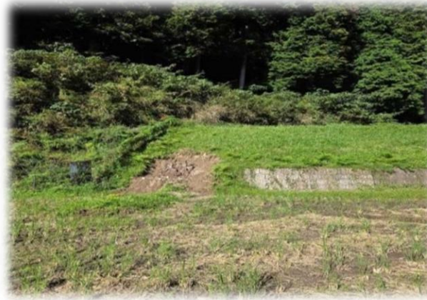
鹿路農地（市補助対象）