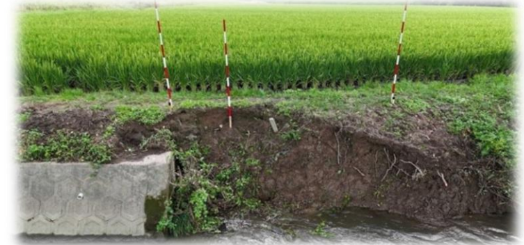
戸井土水路（国庫補助対象）