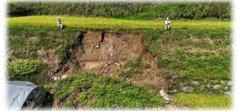
倉谷農地（国庫補助対象）