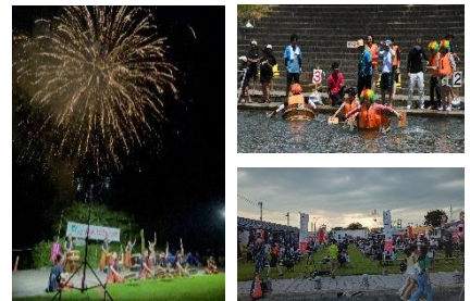
ふるさと夏まつり事業