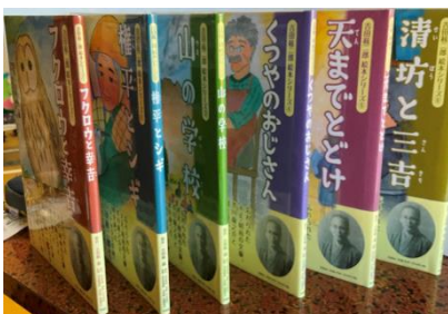
吉田絃二郎絵本作成事業