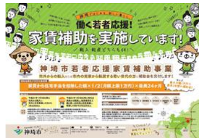
若者応援家賃補助事業