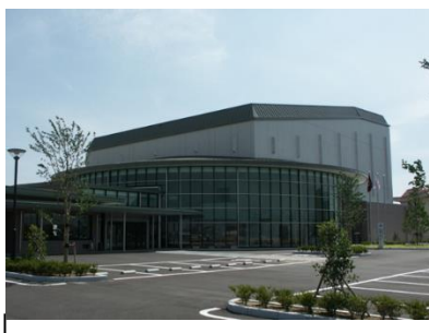
千代田文化会館改修事業