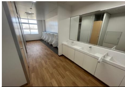
小学校施設環境改善質的整備事業