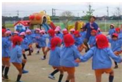
保育士等確保対策事業