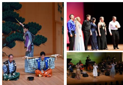
千代田文化会館自主事業