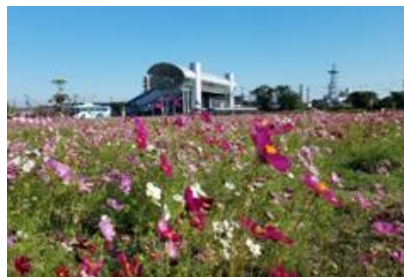
花のある風景整備事業