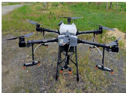
スマート農業推進事業