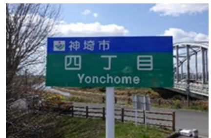
地区看板設置事業