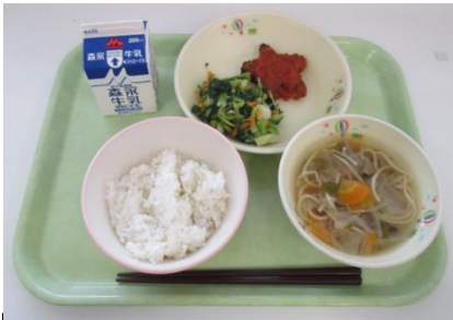
学校給食費助成事業