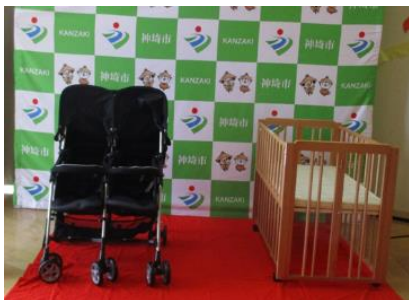
ベビー用品貸与事業