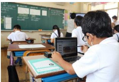
小学校教育 ICT 振興事業