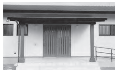
▲整備されたコミュニティセンター