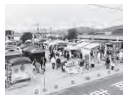
▲毎月第1土曜開催の「櫛田の市」

飲食・販売イベント、コンサート等のステージイベント(ステージ貸し出し可能)、ヨガ等の健康教室