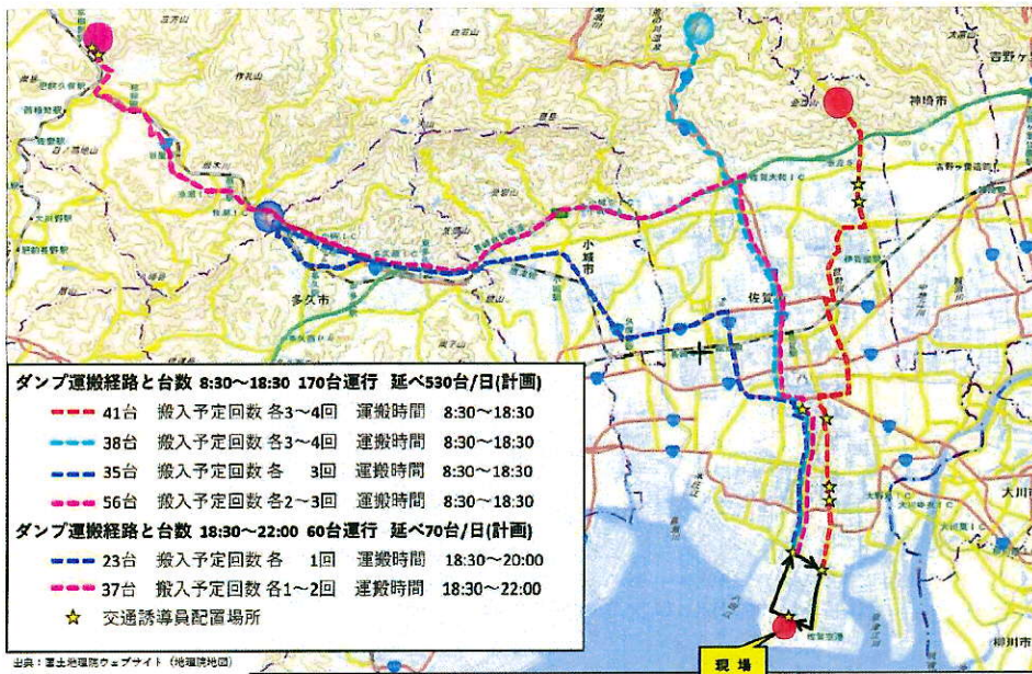
専用サイトで公表している日々の運搬経路等(10月4日時点)