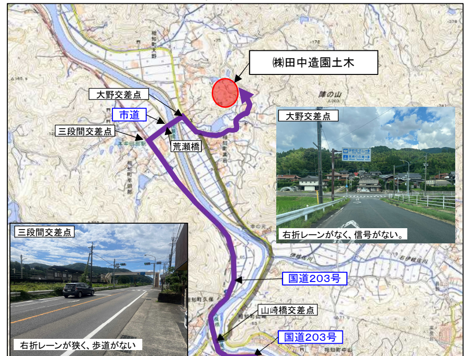
【ご意見の運搬ルート(案)(復路)】