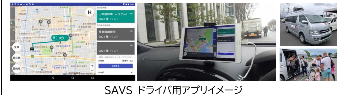
SAVS ドライバ用アプリイメージ