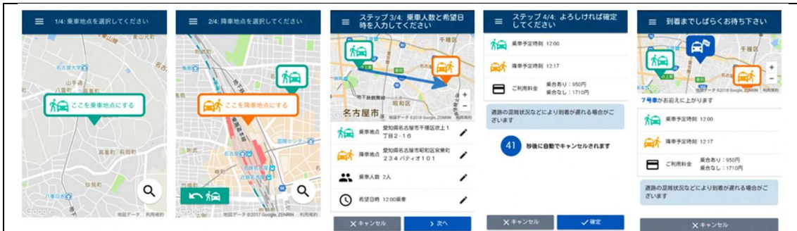
SAVS 乗客用アプリイメージ