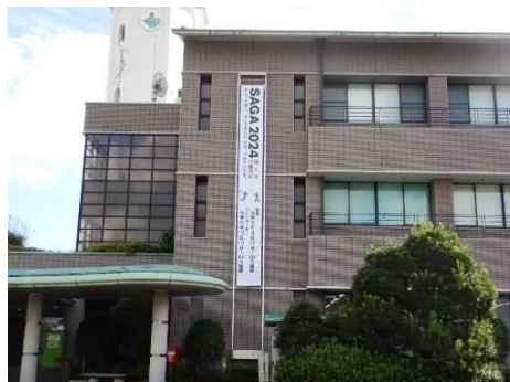
市役所千代田交流センター