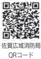
佐賀広域消防局 QRコード