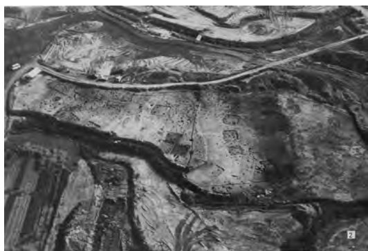
▲志波屋六本松遺跡