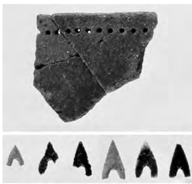
▲吉野ヶ里縄文土器・石器