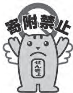
政治家の寄附禁止