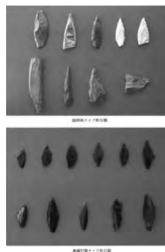
▲船塚遺跡出土石器