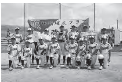
優勝 神崎球友クラブ