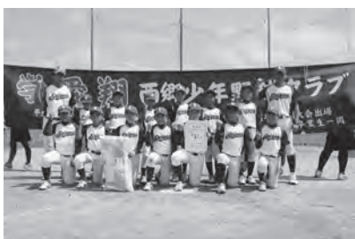
準優勝 西郷少年野球クラブ