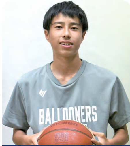
強化指定選手 バスケットボール

佐賀県の「SAGAスポーツピラミッド構想」は、全国、世界で活躍する可能性のある選手を「スポーツエリートアカデミーSAGA」の支援対象選手とし、その中でも佐賀県で開催される第78回国民スポーツ大会（SAGA2024）で主力となり得る選手を「強化指定選手」として認定しています。「Good Luck!!」では、県から「強化指定選手」として認定を受けた選手たちをご紹介します。