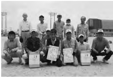
優 勝 丁太田地区(左)・崎村地区(右)