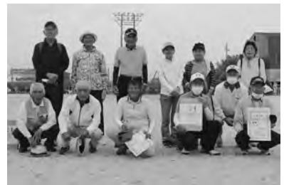
優 勝 横武地区(左)・餘江地区(右)