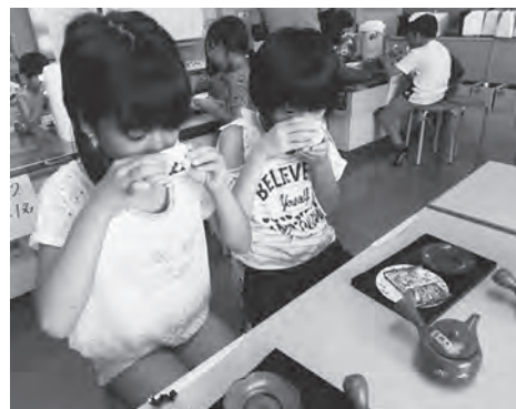
【日本茶を楽しもう】

子どもたちは、このドリームパークをいつも楽しみにしています。自分で作成したもので遊んだり、異学年の友達と一緒に活動したりと、子どもたちは体験を通して楽しい時間を過ごしています。また、児童の真剣な顔や笑顔、充実した顔を見ることが出来ます。