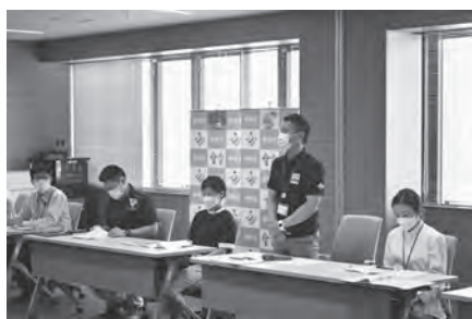
▲チーム会議で意見を出す若手職員

6月30日に行った初回チーム会議では市長から「若い感覚を生かし、これからの神埼市を魅力あるまちにするんだ」という思いで取り組んでほしい」と激励の言葉をいただきました。今後は、9月に行われる会議の中で若手職員がまとめた提案を発表する方針です。