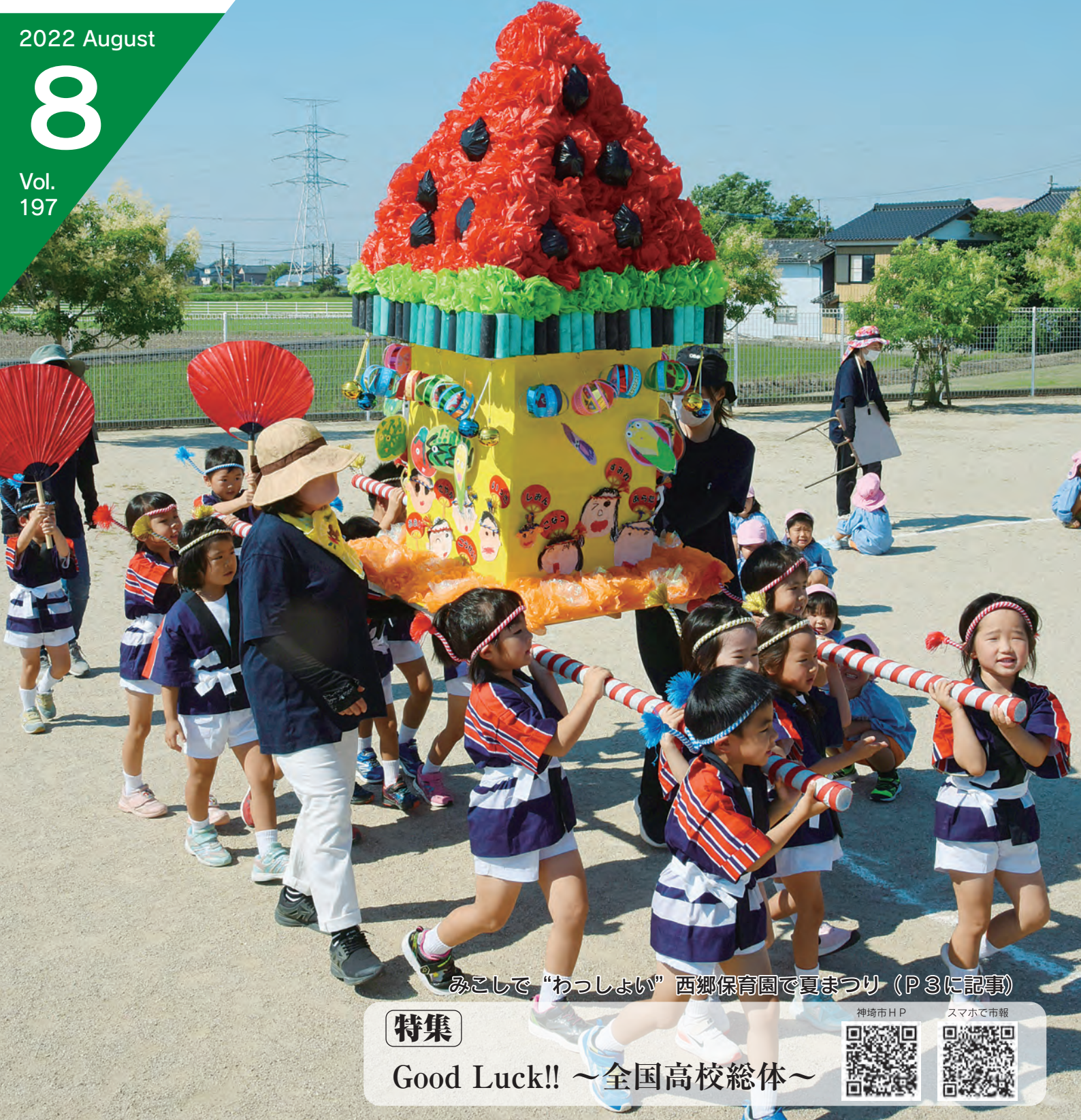
みこしで“わっしょい” 西郷保育園で夏まつり (P3に記事)