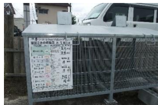
地区ごみ収集看板設