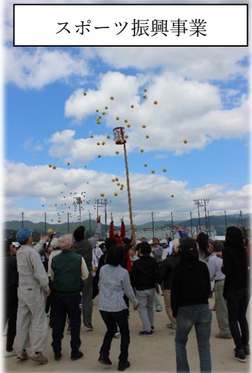
スポーツ振興事業