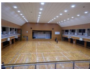
体育施設改修事業