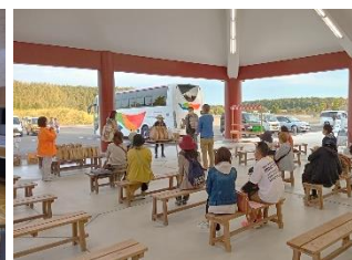
神崎市魅力発信事業