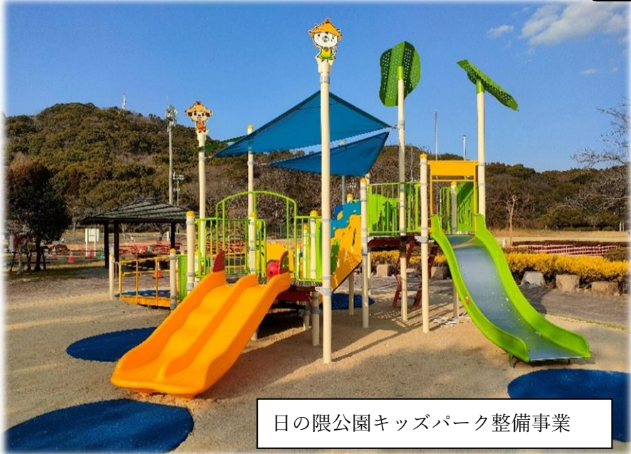
日の隈公園キッズパーク整備事業