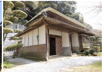
伊東玄朴旧宅整備事業