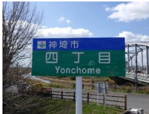
地区看板改修工事