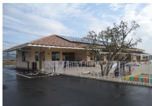
保育園フラクタル日よけ設置