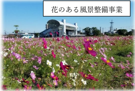
花のある風景整備事業