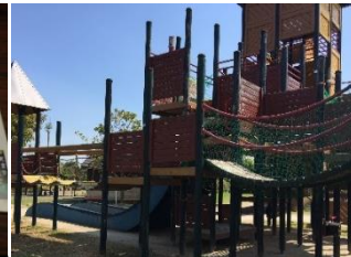
日の隈公園遊具修繕