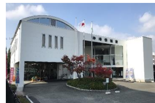
神崎情報館整備事業