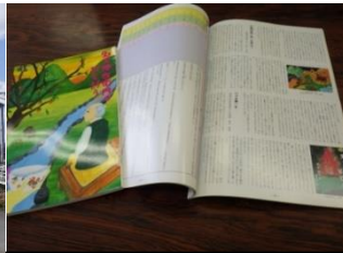
吉田絃二郎作品集編纂事業