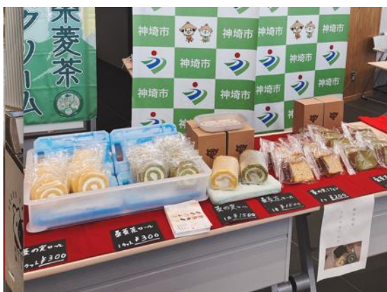
(菱の実ロール・桑菱茶ロール)