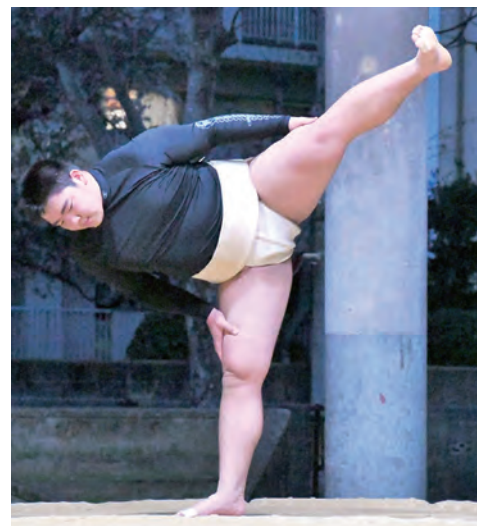
市報かんざき 2022. 5月号 30

全国大会を経験したことは大きな刺激になりました。特に「体の小さい人でも強い人がいて、体格だけで勝てるわけではないことを実感した」と言います。学んだことは「体を大きくするだけでなく、体をうまく使うこなさなければ、全国大会での優勝は狙えない」ということ。以来「どのように体を使えば押し相撲で勝つことができるか」を考えながら、稽古に励んでいます。