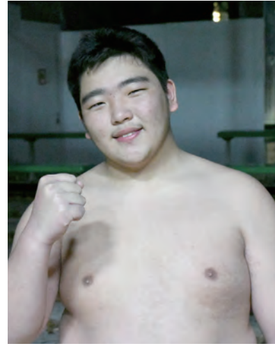
国スポ強化指定選手 相撲

佐賀県の「SAGAスポーツピラミッド構想」は、全国、世界で活躍する可能性のある選手を「スポーツエリートアカデミーSAGA」の支援対象選手とし、その中でも佐賀県で開催される第78回国民スポーツ大会(2024年)で主力となり得る選手を「佐賀国スポ強化指定選手」として認定しています。「Good Luck!!」では、県から「佐賀国スポ強化指定選手」として認定を受けた選手たちをご紹介します。