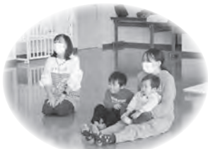
リズム遊びの風景