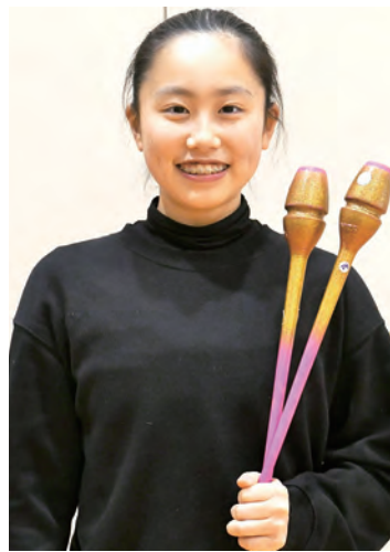
国スポ強化指定選手 女子新体操

佐賀県の「SAGAスポーツピラミッド構想」は、全国、世界で活躍する可能性のある選手を「スポーツエリートアカデミーSAGA」の支援対象選手とし、その中でも佐賀県で開催される第78回国民スポーツ大会(2024年)で主力となり得る選手を「佐賀国スポ強化指定選手」として認定しています。「Good Luck!!」では、県から「佐賀国スポ強化指定選手」として認定を受けた選手たちをご紹介します。