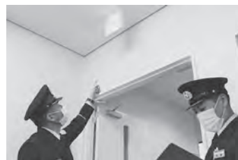
避難経路を確認しましょう。誘導灯(誘導標識)が目印です。