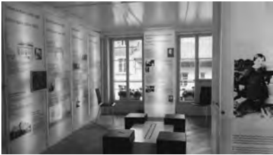
アインシュタイン・ハウスの室内

アインシュタインは大学卒業後、ベルンの特許庁に就職しました。その後しばらくして結婚し、前述のメインストリートに面したアパートで暮らしました。そのアパートで、特殊相対性理論などの重要な論文を書いています。アパートは現在「アインシュタイン・ハウス」として観光スポットになっており、家の中にはアインシュタインが暮らしていた当時の家具や研究資料などが展示されています(写真)。写真の右端に子供が写っていますが、これはアインシュタインの幼少期のものです。