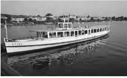
チューリヒ湖畔に広がる街並み

まずチューリヒですが、スイスの北東部にあり、ドイツ寄りに位置しています。スイス最大の街であり、商工業や金融業の中心地です。経済都市でありながら、街がチューリヒ湖のほとりに広がっているの、リゾート地のような雰囲気があります(写真)。