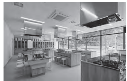
脊振公民館の調理室

なお、公民館の利用の仕方や活動内容などは「市報かんざき」や全戸配付のお知らせ、市のホームページなどでお知らせしています。また、直接、3つの公民館が市教育委員会にお問い合わせください。