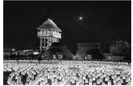
昨年の「光の響」の光景