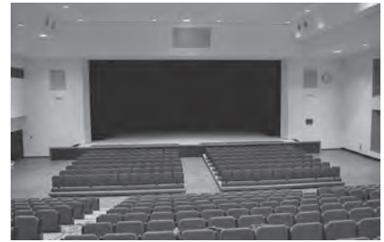
神埼市中央公民館の講堂

ところで、市民の皆さまは、各地区の自治公民館以外で神埼市立の公民館は何館あるかご存じでしょうか。答えは、神埼市中央公民館と千代田公民館、脊振公民館の「3館」です。神埼市中央公民館と脊振公民館は以前からありましたが、千代田公民館は、令和3年5月6日に千代田交流センター内に開館しました。また、脊振公民館も、令和2年5月25日に脊振交流センター内に新たに開館しました。公民館の部屋の概要は、下記のとおりです。