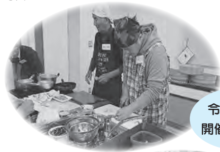
令和元年度 開催時の様子