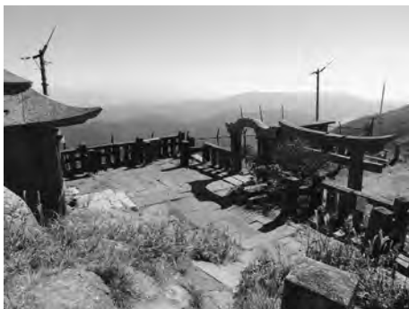
▲石宝殿を囲む玉垣