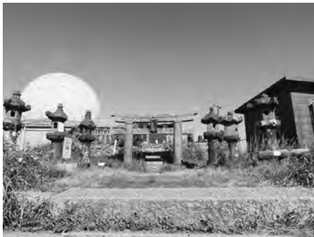
▲石造鳥居と石燈籠群