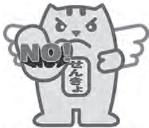
贈らない・求めない・受け取らない

例年12月号でお知らせしている「明るい選挙ポスターコンクール」の結果は2月号でお知らせする予定です。