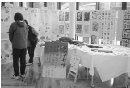
作品展 (脊振交流センター)

市内小中学校に通う児童生徒の絵画などの作品展を市役所本庁などで開催しました。子どもたちの個性豊かで想像力溢れる作品が並び、来場者の目を惹きつける作品展となりました。