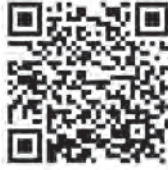
相談メールフォーム

○対象 県内勤労者とその家族 ※「なんでも相談」および無料法律相談会の問い合わせは、メールでも可能です。