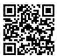
日本年金機構ホームページ

問 日本年金機構ホームページ（ねんきんネット） https://www.nenkin.go.jp/net/