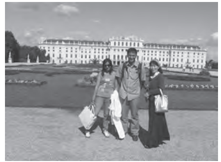
シェーンブルン宮殿

市の中心部からやや離れた所にシェーンブルン宮殿（写真）があります。佐賀大学の私の研究室に留学していたネパール人学生の義兄が国連職員としてウィーンに駐在していたので、彼に案内を頼みました。この宮