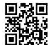
シニアはたらきたいけん推進協議会ホームページ